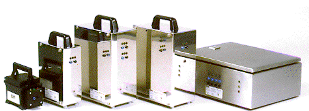
DryTronic® Standard, II, Medium, Compact, ... 30 A

Alle Versionen von Standard bis hin zu den Stärksten sind für kleine private, industrielle, und grosse z.B. historische Gebäude in der Denkmalpflege und für Fresken geeignet.